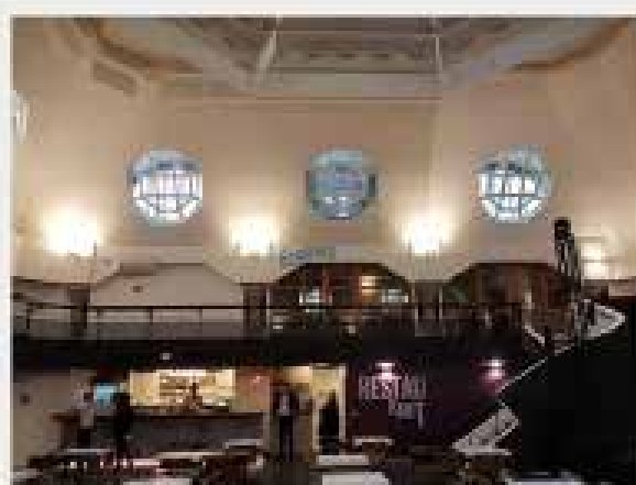
— L'air et la salle de concert de la Grande Poste se sont classés.

Construit dans les années 30, l'immeuble de la Grande Poste, à Bordeaux, va à nouveau vibrer. Mirabelle Mirault qui a racheté ce bâtiment situé tout près de la place Cornalba a décidé de lui insuffler son énergie et son imagination. Après un an de travaux « et pas des plus faciles », la Grande Poste est désormais ouverte avant d'être inaugurée le 3 décembre. Surmontée par un vaste dôme en plomb de verre, la salle est aussi centrale, en partie haute, par des grands fûts à pans coupés octogonaux. L'espace est occupé, au rez-de-chaussée, par le bar et le restaurant ainsi que par une scène. On accède à l'étage grâce à deux escaliers qui animent la soirée. Tout le tour, la galerie desservant des « échoppes ».