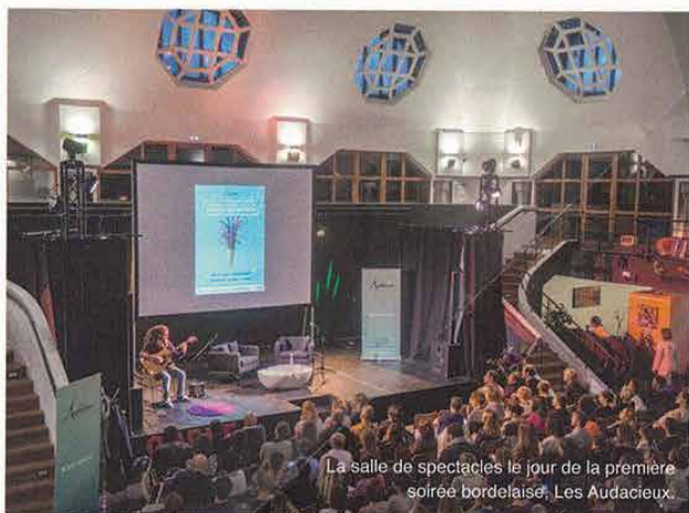
La salle de spectacles le jour de la première soirée bordelaise, Les Audacieux.